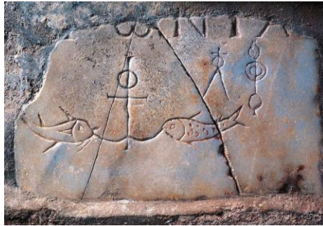
Het anker van onze hoop

In de Oudchristelijke tijd werd het kruis van Christus niet als martelwerktuig verbeeld, maar als teken van hoop, redding en overwinning. Immers, Christus heeft door het kruis de dood voor ons overwonnen. Eén van de oudste voorbeelden daarvan is te zien op een grafplaat in de catacomben van Domitilla te Rome uit de 3de eeuw.