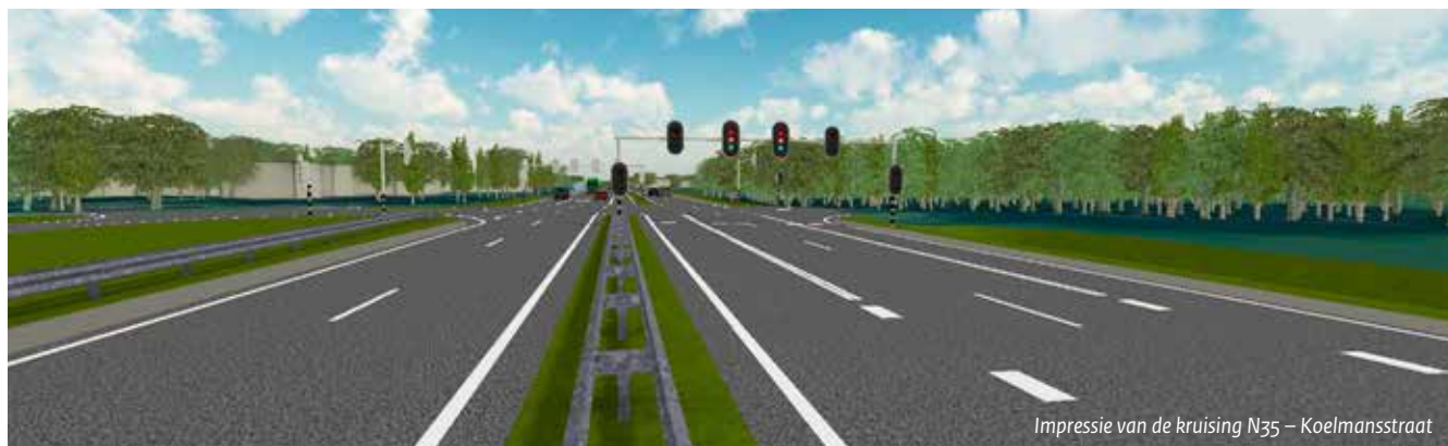
Impressie van de kruising N35 – Koelmansstraat

Ontwerptracébesluit | Geluidsschermen | Landschappelijke inpassing | Fauna | Uw mening geven | Planning