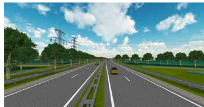
Impressie van de N35 ter hoogte van de fietstunnel Oudeweg