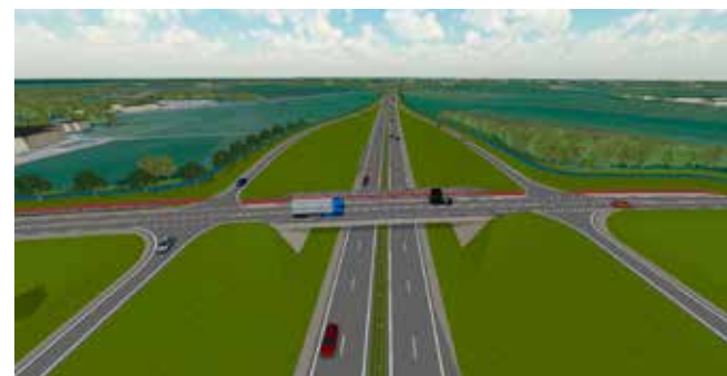
Impressie van de ongelijkvloerse aansluiting

Loop tussen 18:00 uur en 21:00 uur binnen om kennis te nemen van de plannen en informatie te krijgen over de procedure. Er zijn medewerkers van Rijkswaterstaat aanwezig om vragen te beantwoorden.